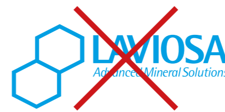
Modificare i caratteri e i colori istituzionali