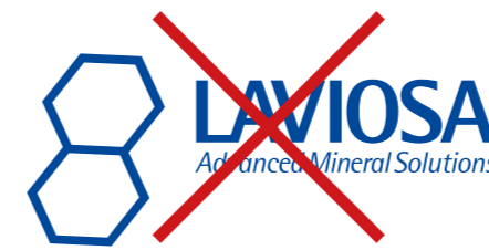
Modificare la composizione o la proporzione del Logo Marchio

In questa pagina sono illustrati alcuni esempi di errato impiego del Logo Marchio.