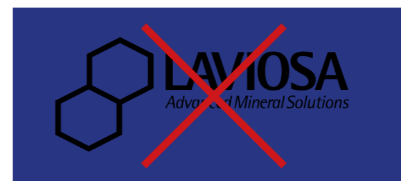
Ignorare le differenti versioni del Logo Marchio e le loro applicazioni