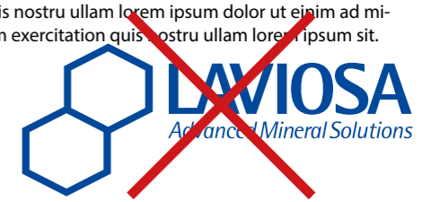
Ignorare l'area di rispetto del Logo Marchio