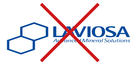
Deformare o distorcere il Logo Marchio